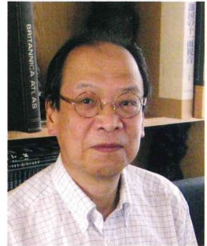
大阪人間科学大学 人間科学部 健康心理学科