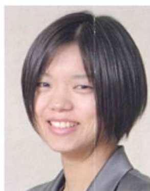
大阪人間科学大学 人間科学部 社会福祉学科

本学では、今年度から教職課程が設置され、高校の公民や福祉、さらに特別支援学校の教員免許が取得できるようになりましたが、私は主に特別支援学校教員の教職課程の科目を担当します。約二五年ぶりに大阪に戻り、やや浦島太郎気分浸っています。よろしくお願いたします。