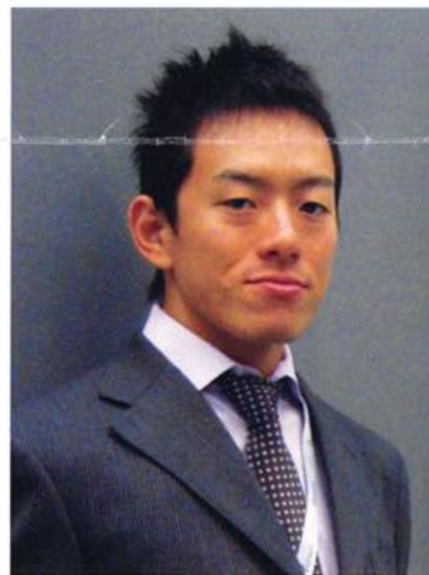
大阪人間科学大学校友会