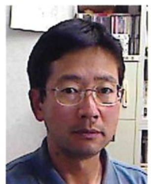
大阪人間科学大学 人間科学部 社会福祉学科

この会報が皆さまにとって、少しでも母校の思い出を呼び戻す切っ掛けとなると幸いです。