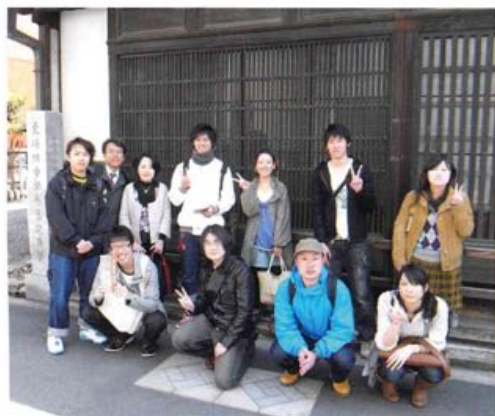
*写真は、ゼミ生・院生との見学会(通塾)のものです。

皆さんも仕事などで忙しいとは思いますが、校友会総会・大学祭・あかりプロジェクトなど、折りを見て大学に来て下さい。そして旧交を温めましょう。皆さんの益々の活躍を期待します。